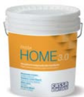
FASSA HOME 3.0 Idropittura traspirante idrorepellente Interni