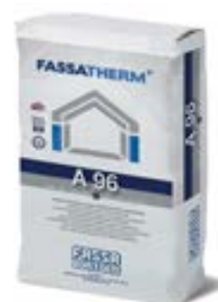
A 96 Collante edile a base cementizia grigio, bianco ed extra bianco