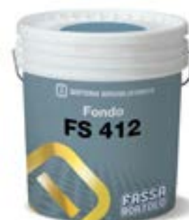
FS 412 Fissativo per cicli idrosiliconici