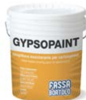
GYP SOPAINT Idropittura mascherante per cartongesso