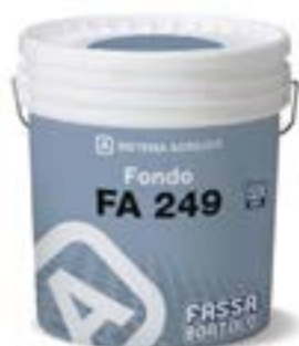
FA 249 Fissativo per sistemi acrilici