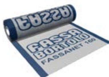
FASSANET 160 Rete di armatura da 160 g/m 2 in fibra di vetro alcali-resistente