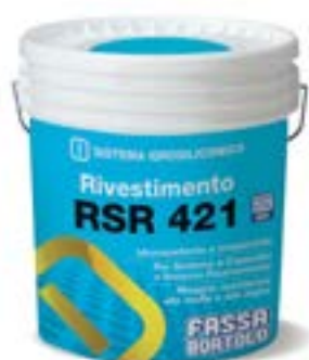
RSR 421 Rivestimento idrosiliconico rustico