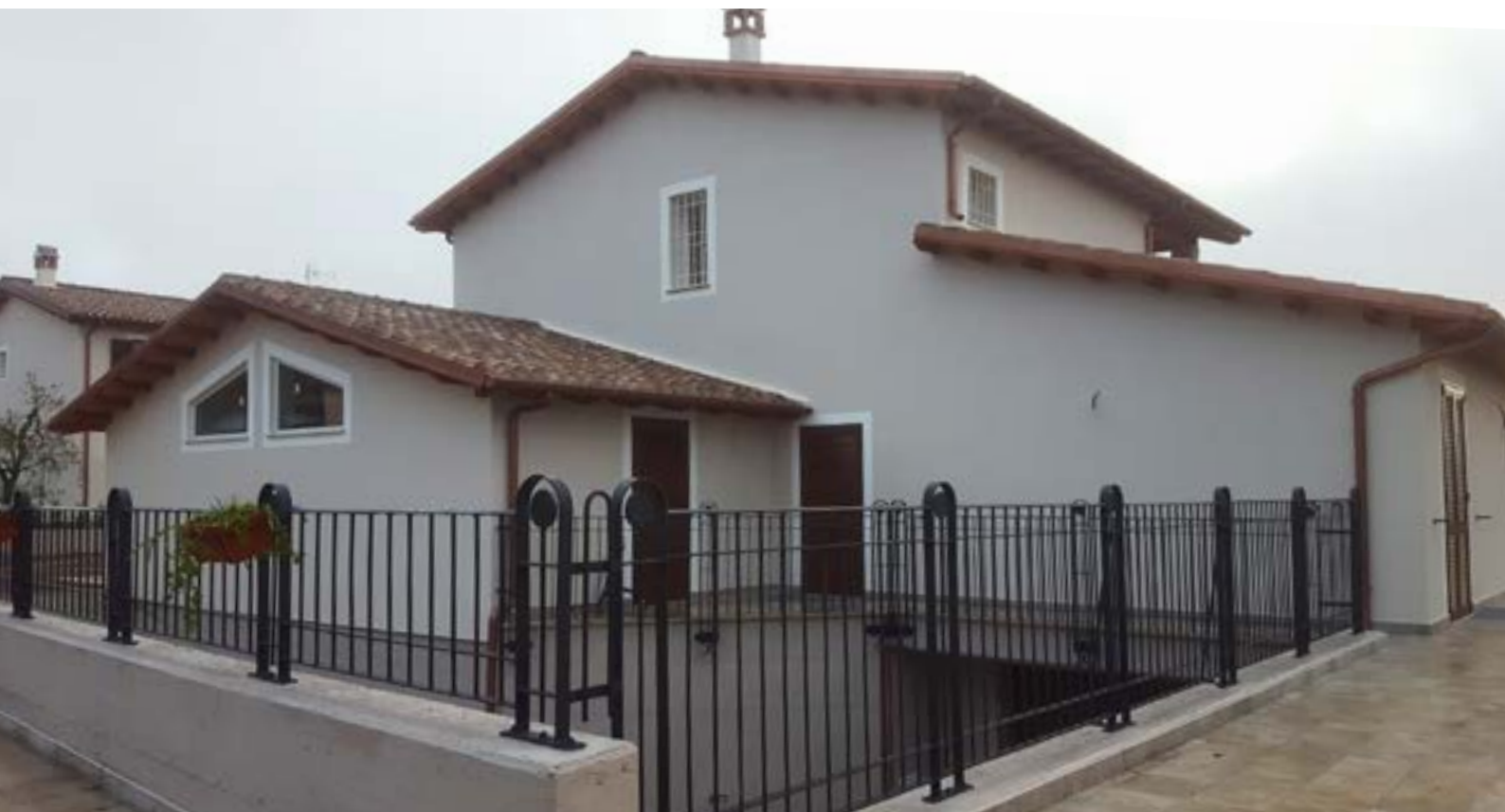
Esterni di una delle villette

A completamento è stato realizzato un rivestimento idrosiliconico rustico con il prodotto RSR 421 , preceduto dal suo corrispettivo fondo isolante FS 412 . Negli interni, le lastre GYPSOTECH® GYPSOLIGNUM sono state tinteggiate con l'idropittura traspirante per interni FASSA HOME 3.0 e con GYPSOPAINT , entrambe precedute dal fondo fissativo FA 249 .