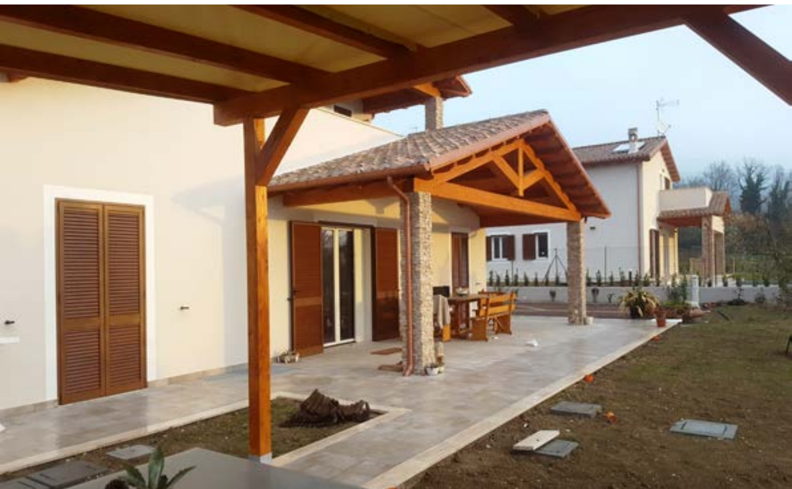
Portico con legno a vista

Il ciclo di impermeabilizzazione dei marciapiedi e portici è stato eseguito con il sistema impermeabilizzante AQUAZIP® . Nello specifico, è stata utilizzata la guaina elastica cementizia bicomponente AQUAZIP GE 97 . Il prodotto è applicato mescolando i due componenti ed è applicato in due mani. Sul primo strato ancora fresco va posizionata la rete in fibra di vetro alcali-resistenti FASSANET 160 . Gli angoli, spigoli e giunti sono stati trattati utilizzando gli appositi ACCESSORI PER SISTEMA AQUAZIP® . Infine, la regolarizzazione e la rasatura delle piscine è stata eseguita con GAPER 3.30 .