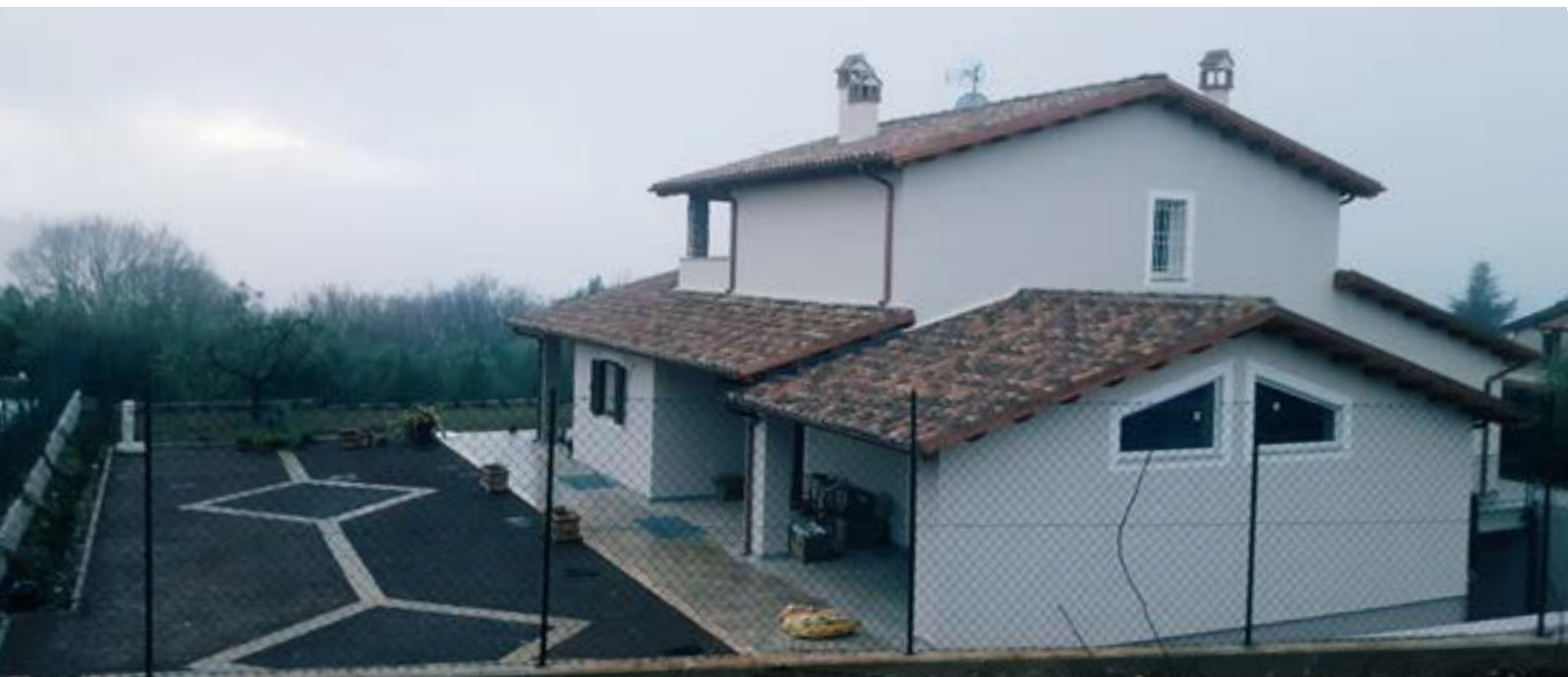
Dettaglio di una delle villette

“ Residence il Colle ” nasce a Terni - Umbria, nella zona del Piedimonte “Borgo Rivo”, ed è composto da 5 unità abitative di nuova costruzione, tutte certificate in classe “A”. È un intervento esclusivo di ville unifamiliari di varie metrature, con legno a vista e complete di impianto fotovoltaico e solare termico. Tutte le unità dispongono di ampi giardini e sono completamente personalizzabili con la possibilità di aggiungere anche la piscina.